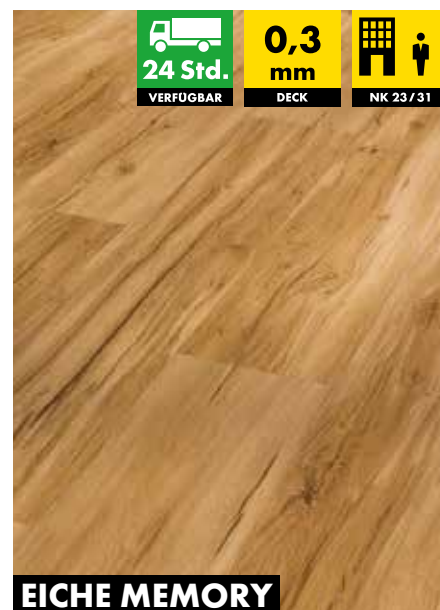
EICHE MEMORY NATUR