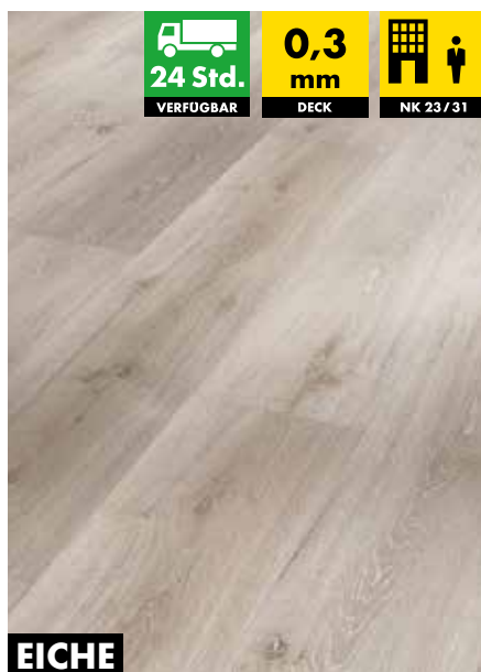
EICHE GRAU GEWEISST