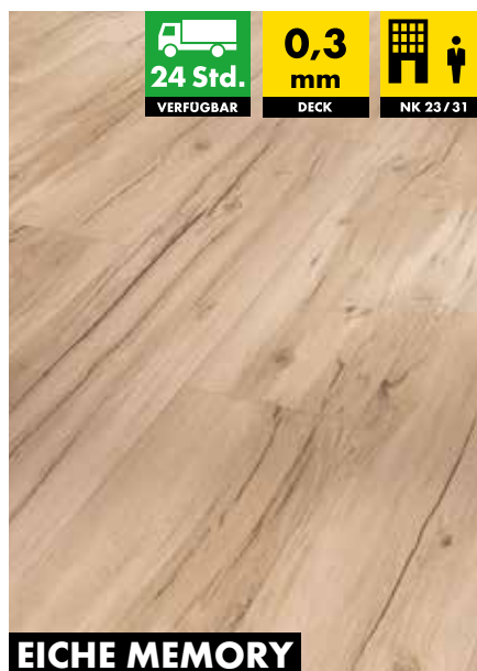
EICHE MEMORY GESCHLIFFEN