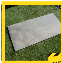
Terrassen- platte HUDSON 50 x 100 x 2 cm

Viele weitere Angebote finden Sie in unserem Fachmarkt. Schauen Sie doch einfach vorbei!