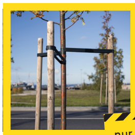
Baum- pfähle Ø 6 cm L: 2,5 m