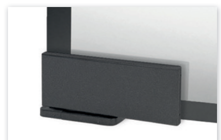
L&H selbstschließender Eckbeschlag