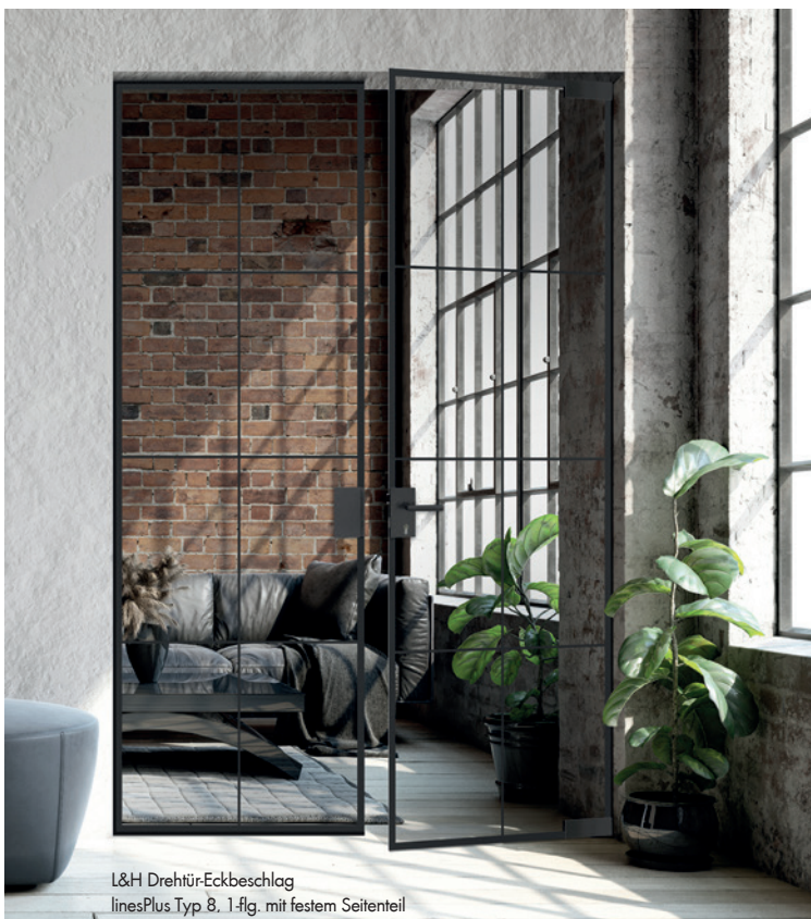
L&H Drehtür-Eckbeschlag linesPlus Typ 8, 1-flg. mit festem Seitenteil