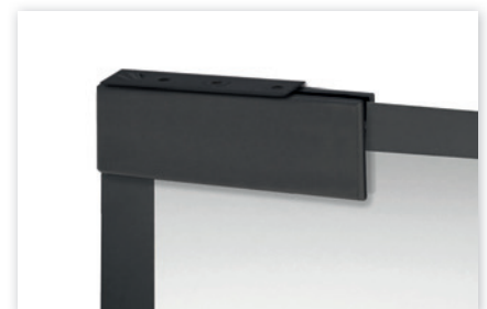
L&H oberer Eckbeschlag inkl. Drehlager