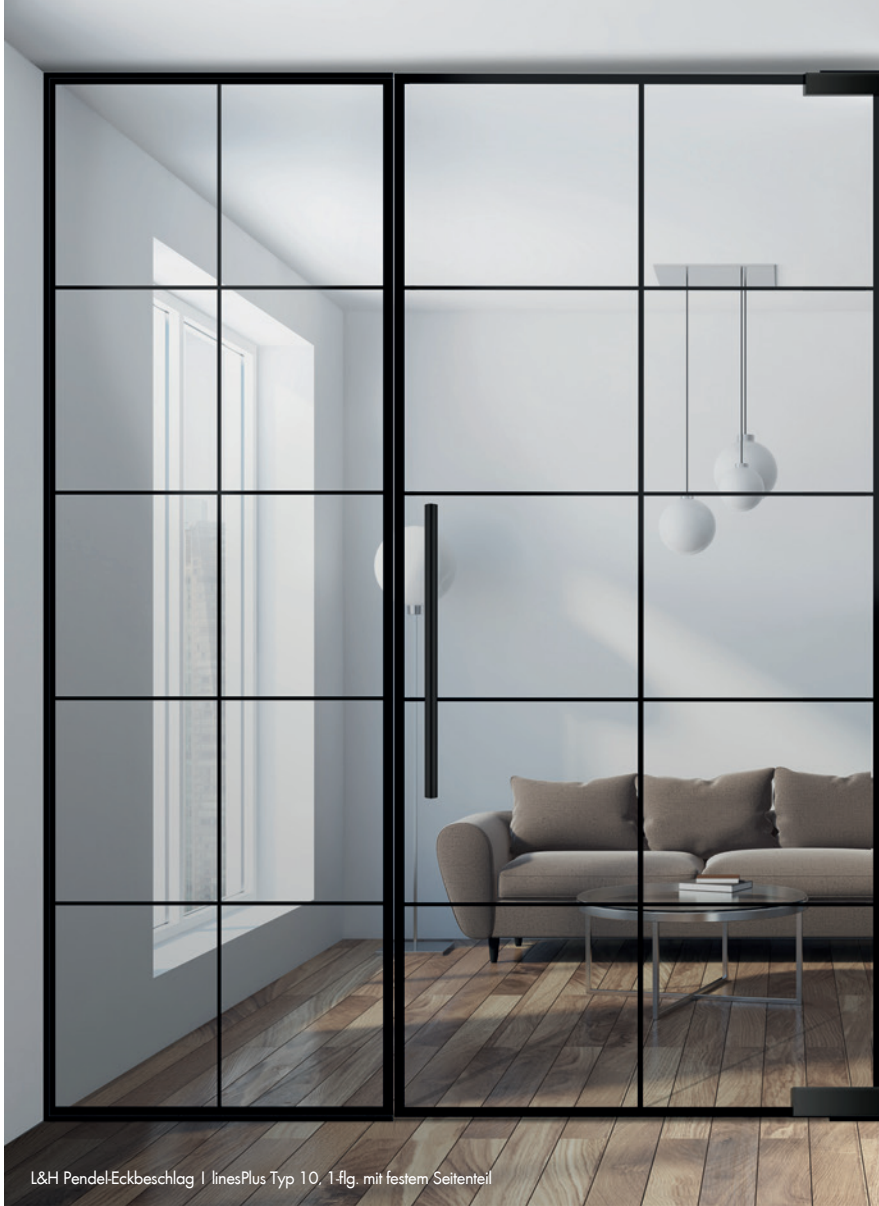
L&H Pendel-Eckbeschlag | linesPlus Typ 10, 1-flg. mit festem Seitenteil