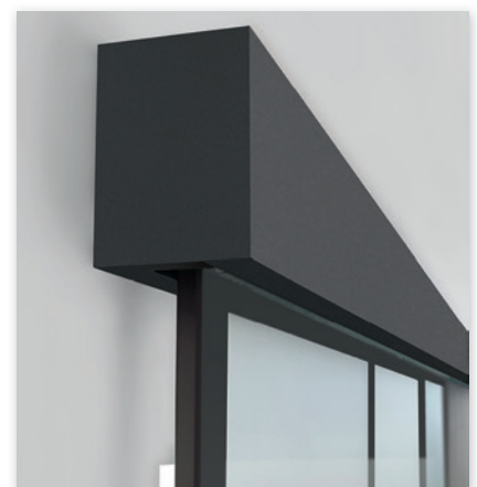
Tvin 2.0 eckig | Anthrazit 703