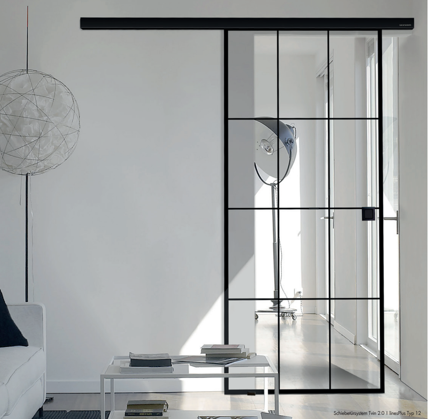
Schiebetürsystem Tvin 2.0 | linesPlus Typ 12